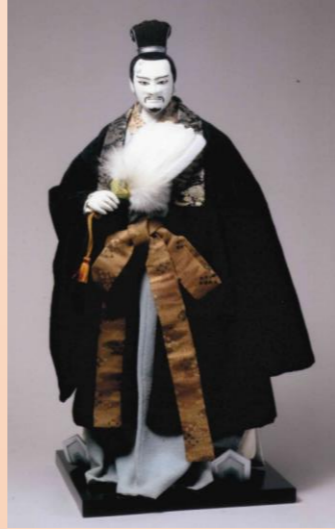
【NHK人形劇『三国志』の人形：左：劉備玄德 右：諸葛亮孔明】川本喜八郎 作