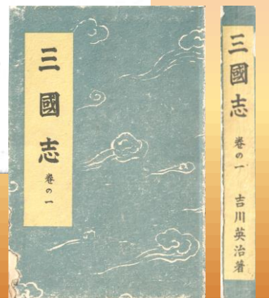
【三国志】昭和15年初版本 講談社

「三国志」シリーズ35周年を記念してシブサワ・コウブランドが開発し、2020年9月からサービスを開始・運営しているスマートフォン用MMO戦略シミュレーションゲームです。 プレイヤーは、3D一枚マップで描かれる広大な中国大陸に都市を構える一君主となり、「この世のすべてを奪い取れ！」をコンセプトに、土地・宝物・名誉などあらゆるものを奪い合いながら中華統一を目指します。 戦闘では各プレイヤーの指揮によって動く、数多の部隊がリアルタイムで激突。援軍・挟撃・集団戦など、プレイヤーの采配が勝敗に直結する緊張感ある戦いが繰り広げられます。