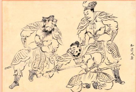
【三国志挿絵原画】矢野橋村 作