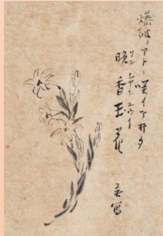
【色紙：晩香玉の花の図】吉川英治 作